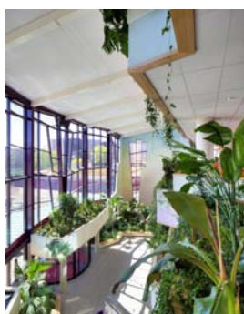
Ospedale "Isala" a Zwolle (NL)

Alberts & Van Huut International Architects in collaborazione con Aan de Amstel Architects